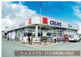
クリエイトS・D小田原飯田岡店