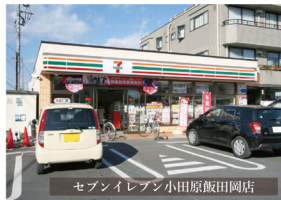
セブンイレブン小田原飯田岡店