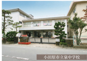
小田原市立泉中学校