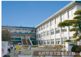
小田原市立富水小学校

小田急小田原線「蛸田」駅と、大雄山線「飯田岡」駅の2路線とも徒歩圏の場所に位置する、開発分譲地。小中学校に近く、お客様の通学便は良好です。 また、毎日の生活には欠かせないスーパーマーケットやドラッグストア、コンビニエンスストアも徒歩圏となっており、快適な毎日が過ごせます。 現地よりすこし北側の方へ向かうと、田園風景の広がる懐かしいロケーションで、ゆっくりとした時間がながれています。 子育て世代に快適なこの土地から、新生活をはじめてみてはいかがでしょうか。