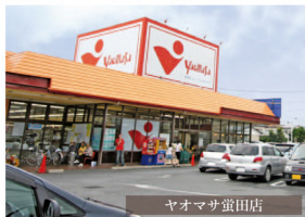
ヤマオマサ蛸田店