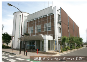
城北タウンセンターいづみ